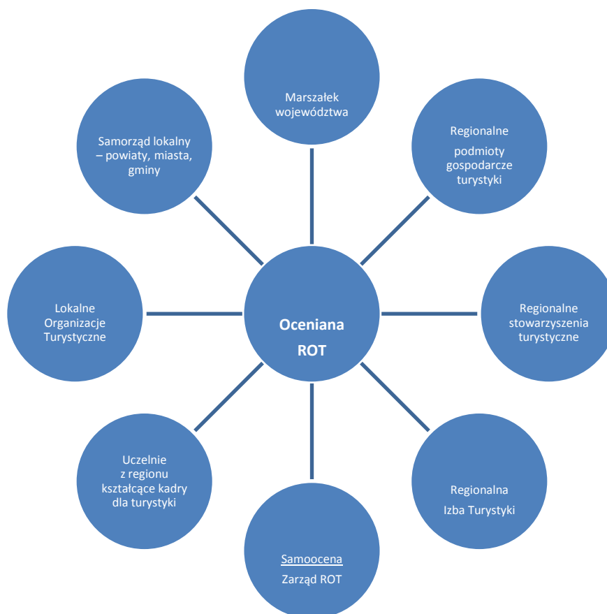
Rysunek 6. „360° ocena ROT”